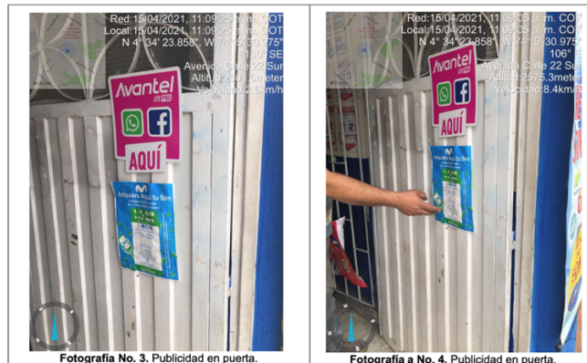
Fotografía No. 3. Publicidad en puerta.