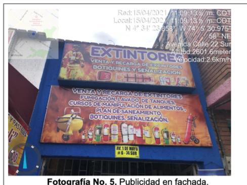
Fotografía No. 5. Publicidad en fachada.